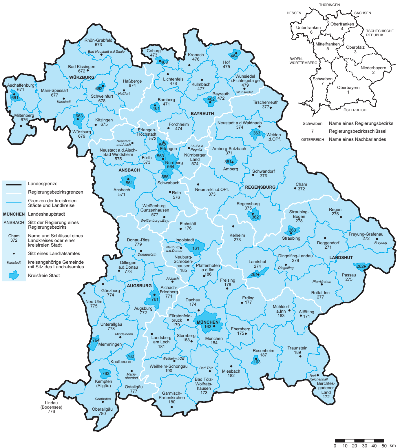
Abb. 1 Verwaltungsbezirksgliederung Freistaat Bayern Regierungsbezirke, Landkreise und kreisfreie Städte Stand: 1. Januar 2013